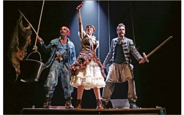
Un momento del espectáculo que llega a Palma.